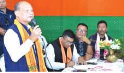
গণসত্তা সেৱা, মৰিগাঁও: আগন্তুক বিধানসভা নিৰ্বাচনক কেন্দ্ৰ কৰি সমগ্ৰ মৰিগাঁও জিলাত ৰাজনৈতিক পৰিবেশ তৃপ্তত উঠিছে। এই পৰিক্ৰমাত এক বিশেষ শব্দ শুনাই গৈছে মহিলা ভোটাৰসকলৰ মাজত। বিভিন্ন অঞ্চলত অনুষ্ঠিত হোৱা নিৰ্বাচনী প্ৰচাৰ সভা আৰু ঘৰেঘৰে সম্পৰ্ক অতিথিৰ অতিথি ভোটাৰসকলে প্ৰকাশ কৰিছে নিজৰ মনৰ কথা। 'হিমন্ত বিশ্ব শৰ্মা আমাৰ বাবে ভোট কৰা নহ'ব। তেওঁৰ নেতৃত্বত ৰাজ্যখন