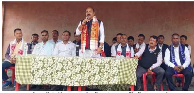
আৰু জগদীশ গাঁৱত নিৰ্বাচনী প্ৰচাৰ চলাই ৰাইজক টংলা সমষ্টিৰ উন্নয়নৰ স্বাৰ্থত পদুম ফুলৰ ছবিত ভোট প্ৰদানৰ আহ্বান জনায়।